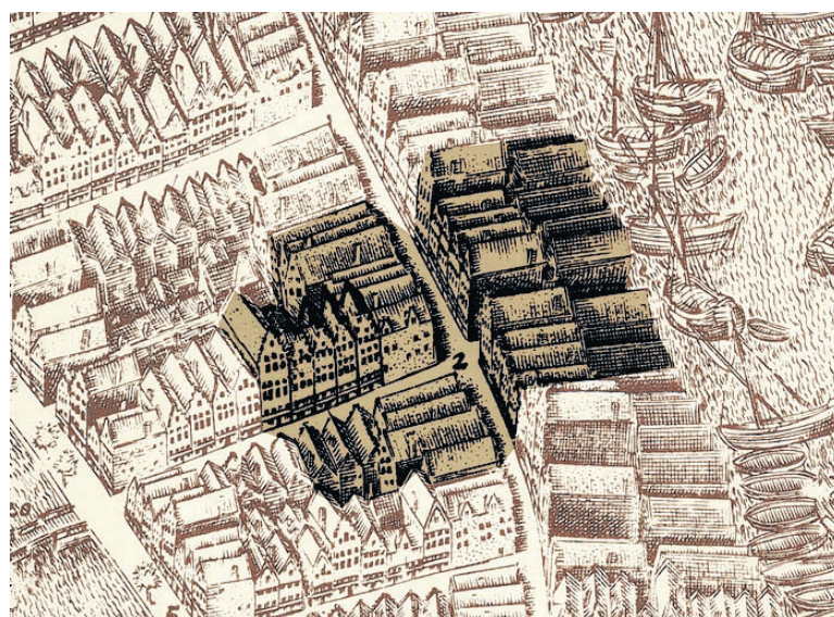
De huizen in de Warmoesstraat die 10 juni 1597 in de fik zijn gegaan.